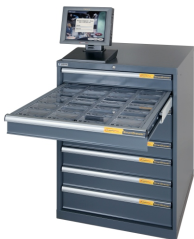
DrawerVend s řídicí jednotkou