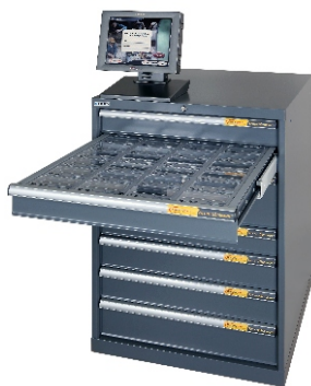
s řídicí jednotkou