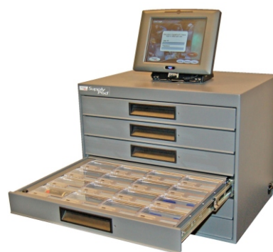
DrawerVend stolní (mini) s řídicí jednotkou

Získejte odpovědnost a evidenci právě teď !